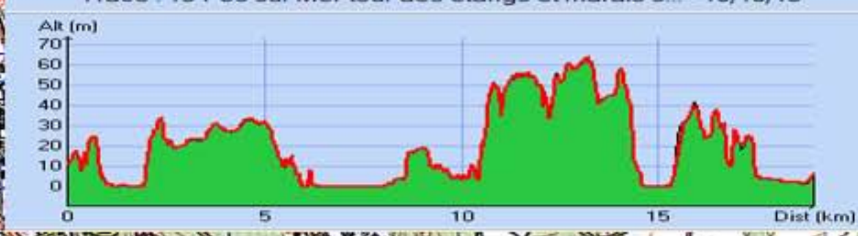
Tracé : 13-Fos sur Mer-tour des etangs et marais s... - 10/10/13